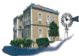
Centro de Apoio a Idosos da Freguesia de Rio de Moinhos

Site: http://cairiomoinhos.nersantsocial.pt/