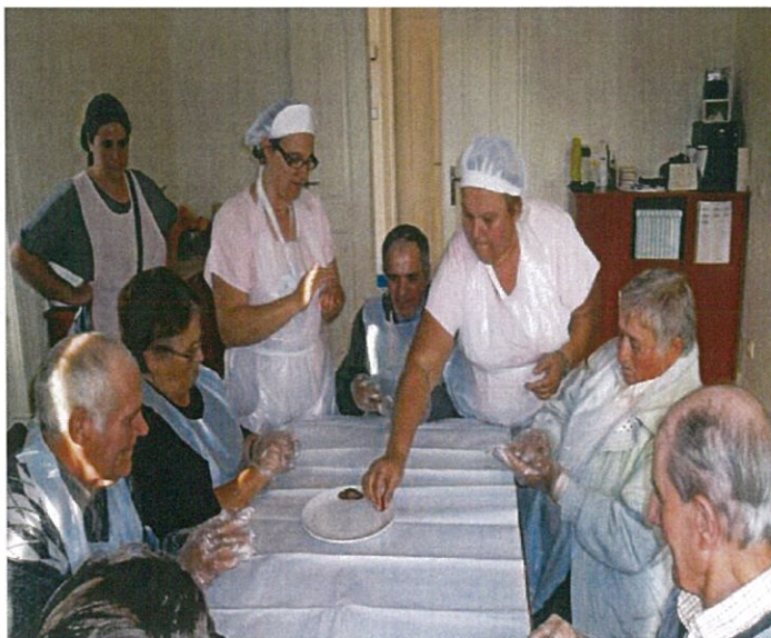
Dia de Todos os Santos