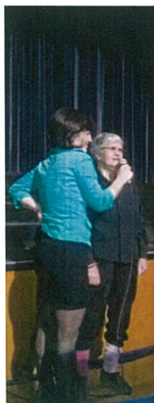
Dia do Idoso- Teatro de S.Pedro

Tentamos seguir o plano de actividades com os utentes, mencionamos algumas actividades desenvolvidas com utentes de SAD e CD, nomeadamente: