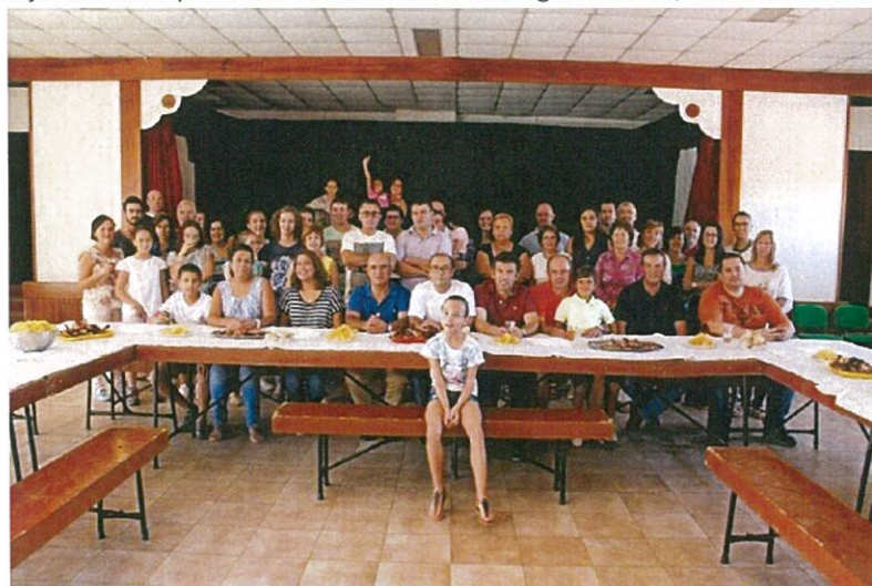
Almoço Convívio após Festa com membros dos órgãos sociais, funcionárias e amigos